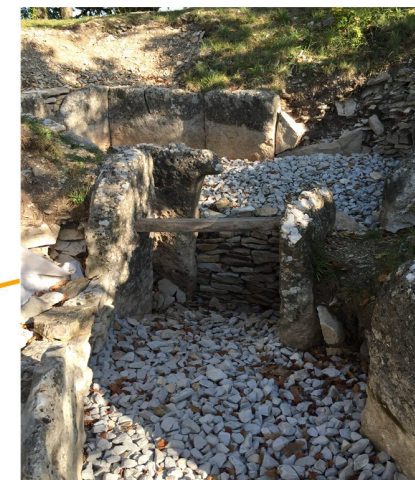
Fontenille : tumulus de la Motte de la Jacquille et sa porte en pierre à gonds unique en Europe