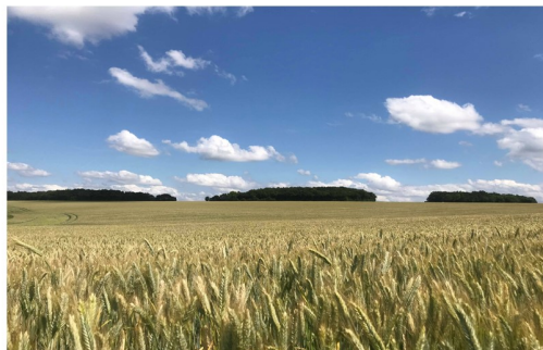
Tusson : ses tumulus géants et l'exposition sur les mégalithes à la maison du patrimoine

Au cœur du Ruffécois, près de 40 monuments néolithiques représentent les premières architectures de l'humanité