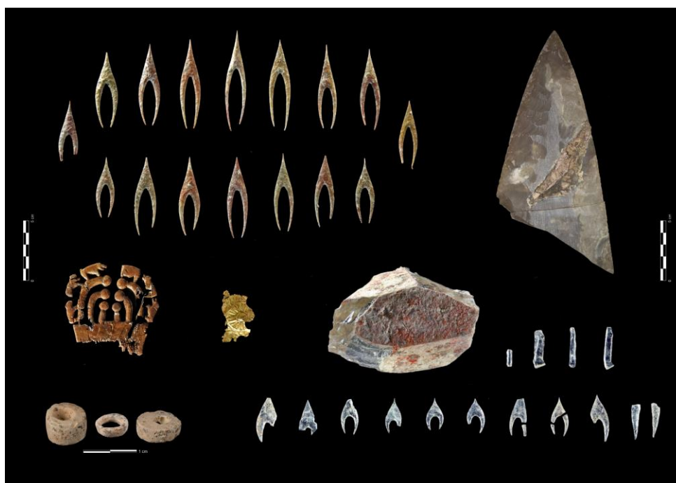
Mobilier du dolmen de Montelirio (Valencia)

Quelles formes d'émergence et de développement du premier mégalithisme de la façade atlantique française ?